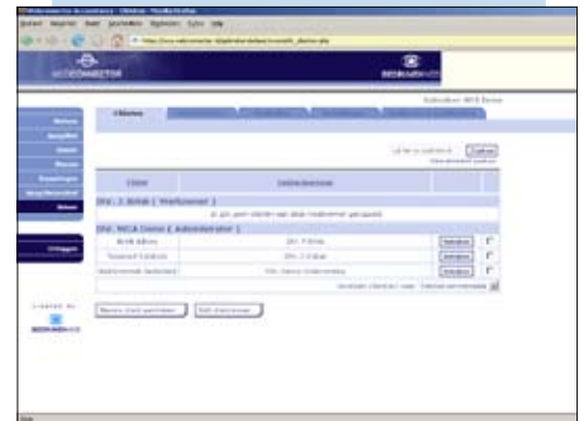
Regie over cliënten, medewerkers enz. ...