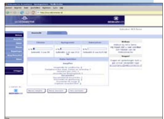
Overzicht cliënten, opslag en verkeer ...

Kijk op www.bedrijvenweb.nl/webconnector voor actuele informatie en de online demo. Liever persoonlijk advies? Neem dan contact op met Bedrijvenweb via telefoonnummer 0347 - 322 444 en vraag naar de specialist Webconnector Accountancy.